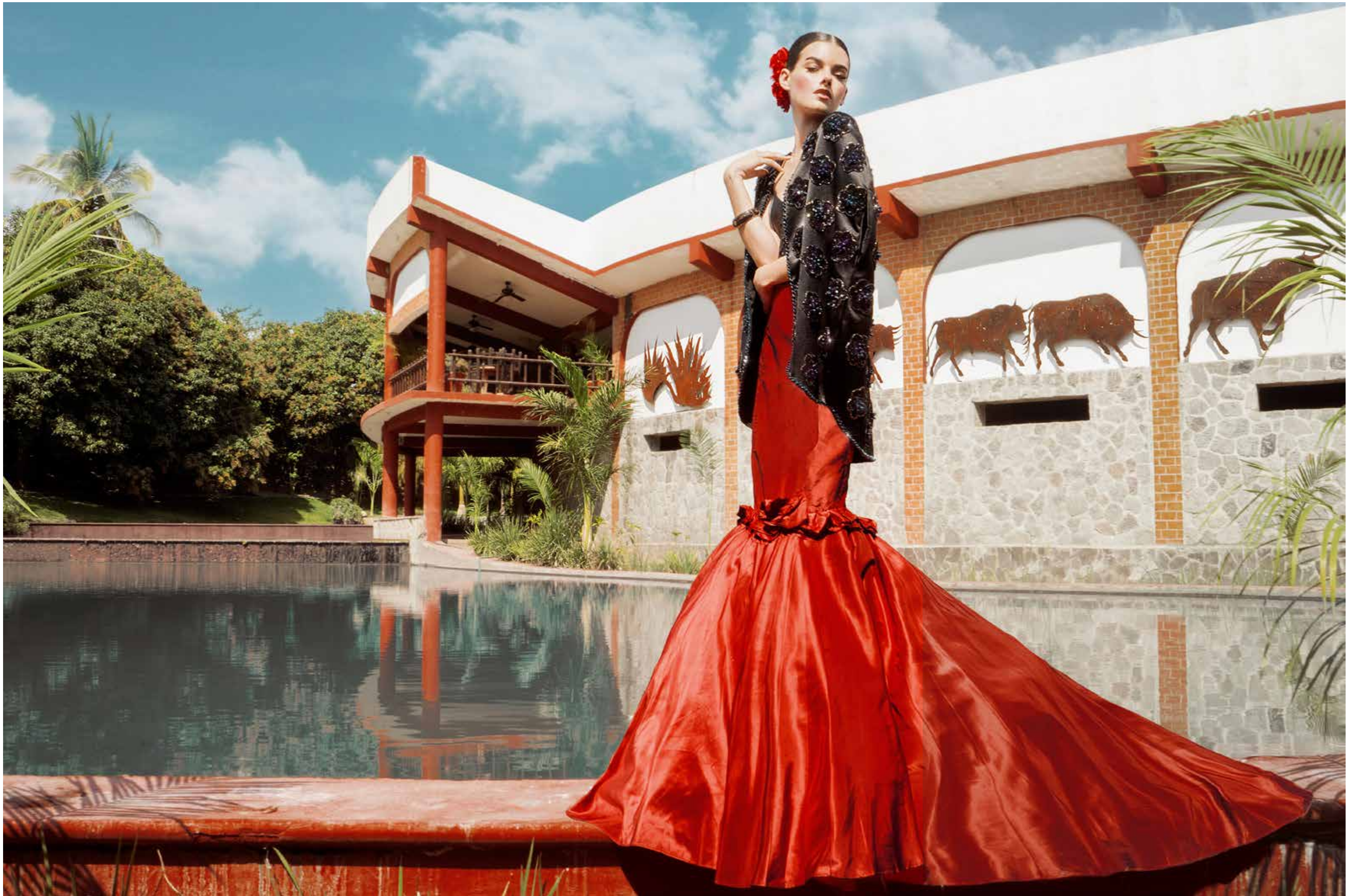
Capa y top por Angela Reyna Falda por Alejandro Carlin Brazaletes por Donatella Fabio