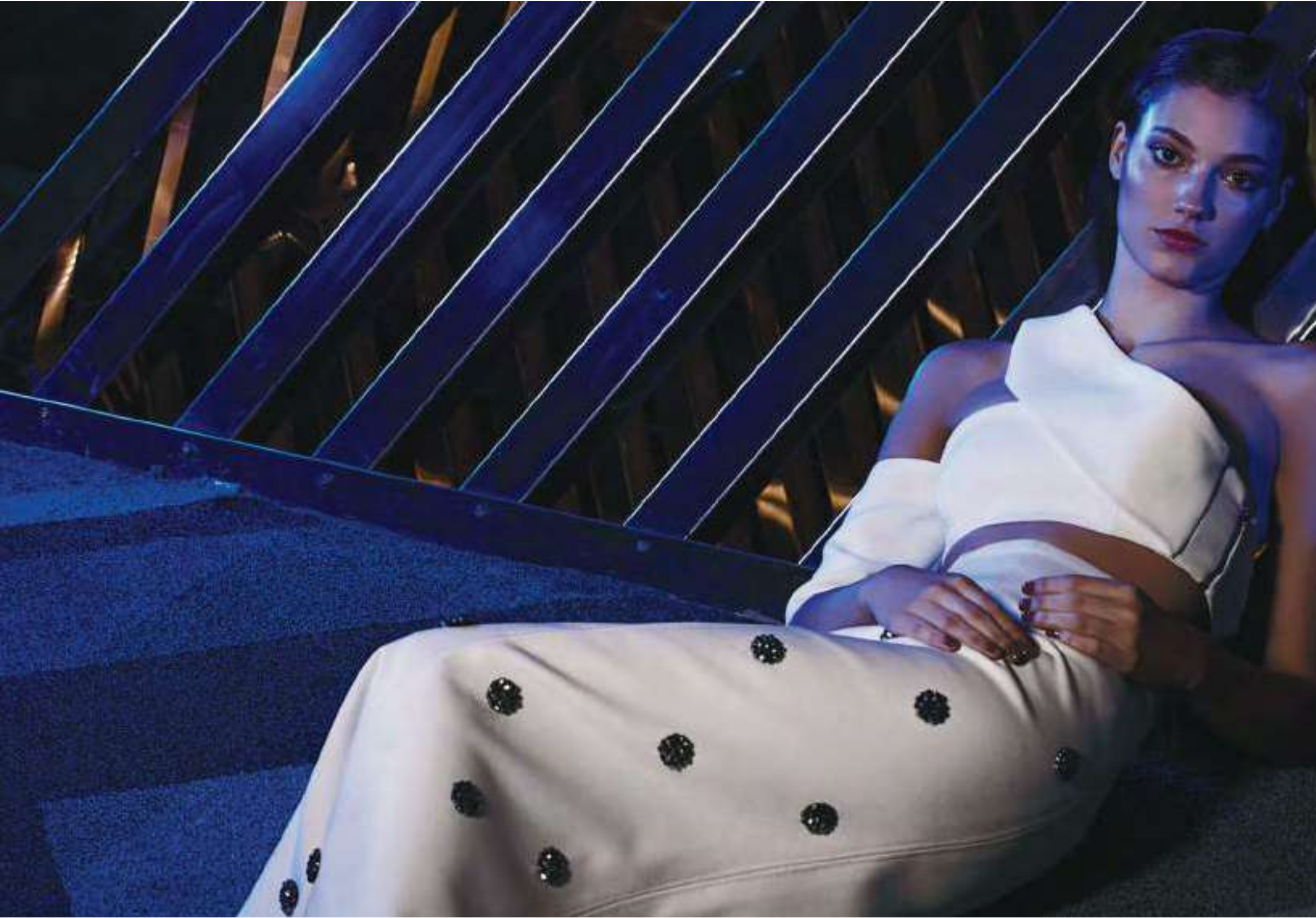
Crop top perla Bimba y Lola Falda perla con lunares Alfredo Martínez